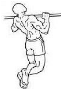
Figura 3 – Posição 02 intermediária.